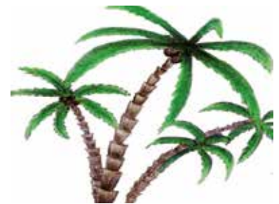
«Abenteuer in Palm City»