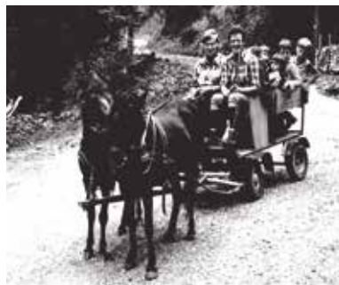
2. Rukila 1970 Hirschwil