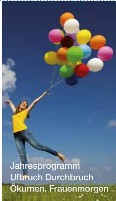
Jahresprogramm Ufbruch Durchbruch Ökumen. Frauenmorgen