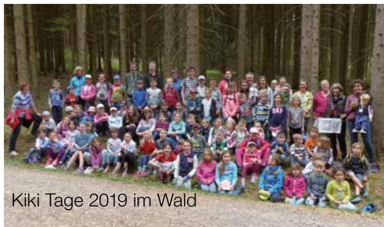
Kiki Tage 2019 im Wald

Die Teilnehmerzahl ist beschränkt und Anmeldungen werden in der Reihenfolge des Eingangs berücksichtigt. Anmeldeformulare werden zwischen dem 27. Februar und 9. März entgegengenommen. (Dieses Jahr können leider keine Helferli-Kinder angemeldet werden.)