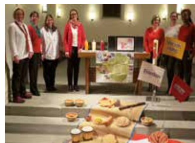
Weltgebetstag Team 2020